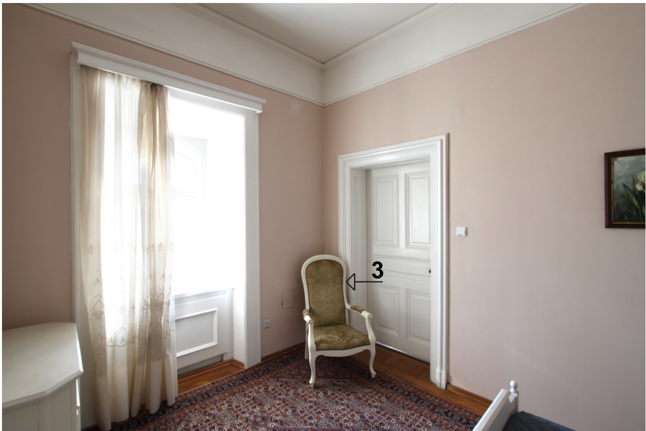
ПОМЕЩЕНИЕ 303. ФОТОДОКУМЕНТАЦИЯ КЪМ 02.2012 Г.