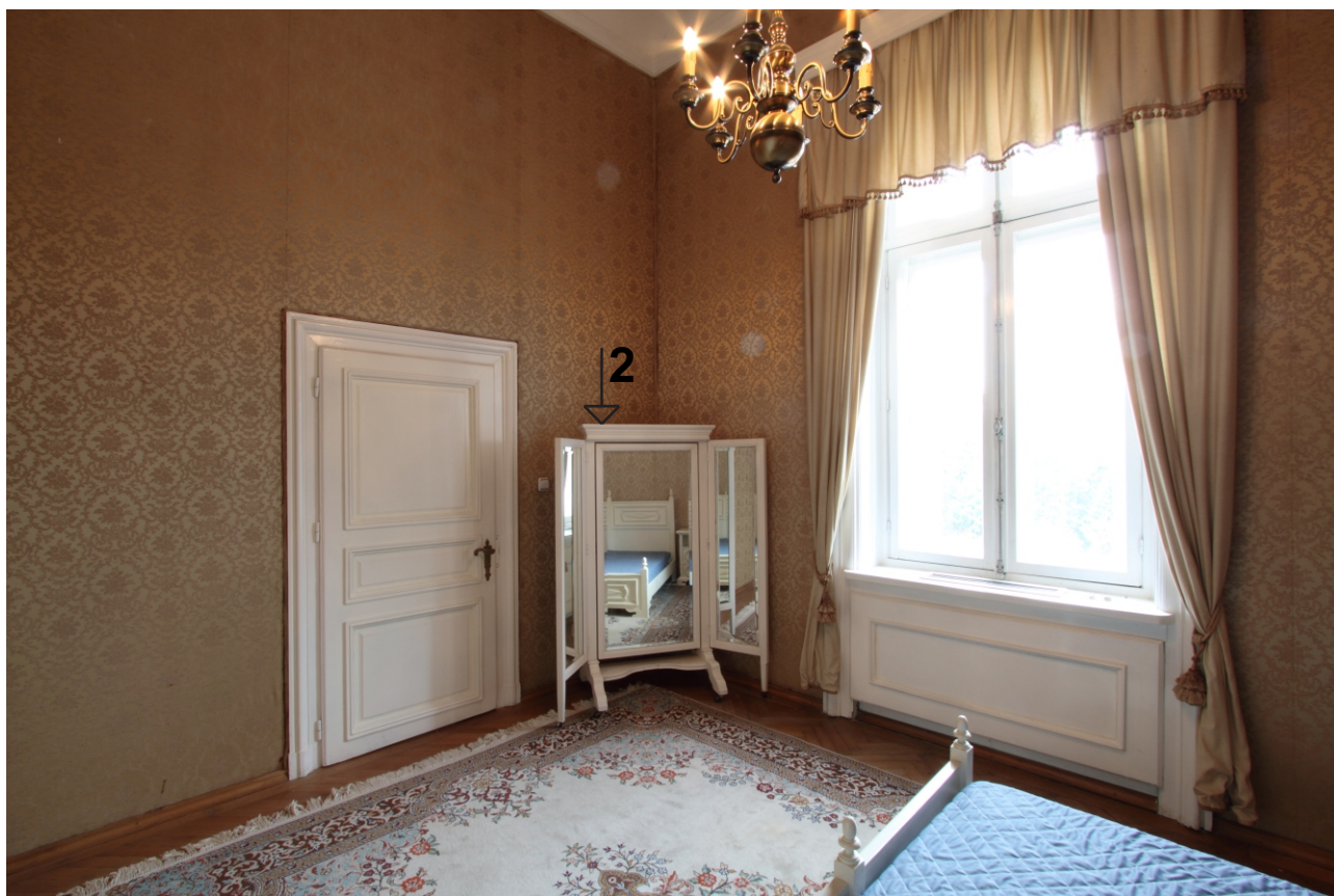
ПОМЕЩЕНИЕ 208. ФОТОДОКУМЕНТАЦИЯ КЪМ 02.2012 Г.