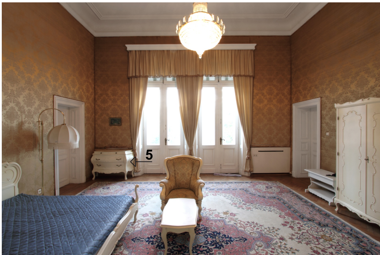
ПОМЕЩЕНИЕ 206. ФОТОДОКУМЕНТАЦИЯ КЪМ 02.2012 Г.