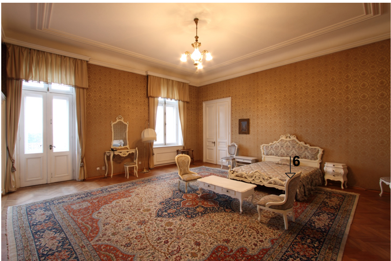
ПОМЕЩЕНИЕ 203. ФОТОДОКУМЕНТАЦИЯ КЪМ 02.2012 Г.