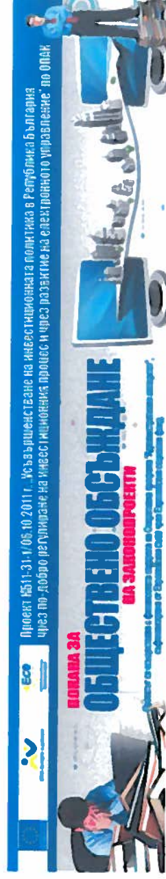
УЕБ Банер 977/175 рѳх