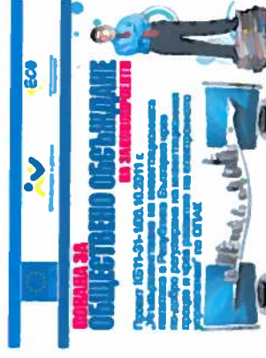
УЕБ Банер 300/223 рѳх